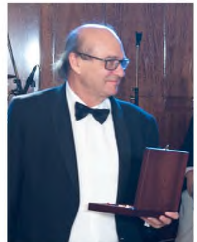
Ив Поцо ди Борго Председатель межпарламентской группы Франция-Центральная Азия в Сенате Франции