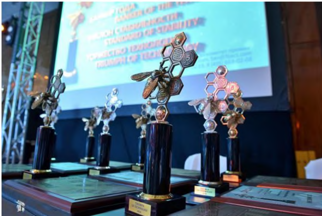
Официальная церемония награждения Международной общественной премией «ФИНАНСОВО-БАНКОВСКАЯ ЭЛИТА ЕВРАЗИИ»